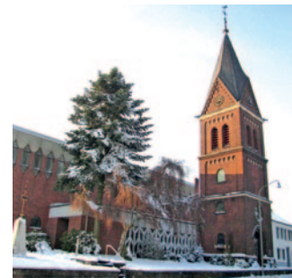
St. Johann Baptist Wildenrath