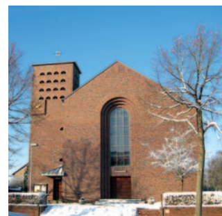
Heilig Geist Tüschbroich

Jeden zweiten Mittwoch im Monat treffen sich die Senioren aus Tüschbroich und Brunbeck zum fröhli- chen Beisammensein. Info: Fam. Klingen Tel 02434- 6632