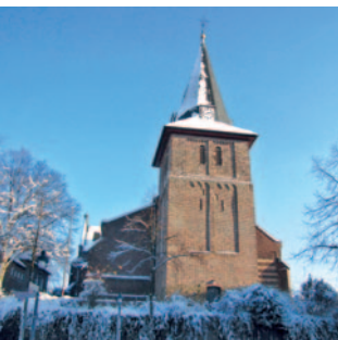
St. Peter und Paul Wegberg