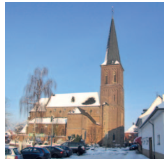
St. Adelgundis Arsbeck