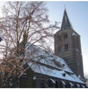
St. Vincentius Beeck

Holtumer Straße 25 Tel 0 24 34 - 33 17 pfarrbuero-beeck@ SanktMartinWegberg.de Di 16:00 bis 17:30 Uhr Fr 9:00 bis 10:30 Uhr Während der Weihnachts- ferien (23.12.2025- 02.01.2026) geschlos- sen.