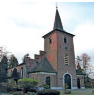
St. Rochus Rath-Anhoven

Josef-Loogen-Straße 4 Mi 17:30 bis 19:00 Uhr Do 9:00 bis 11:30 Uhr Tel 02431-5586