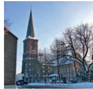
St. Maternus Merbeck