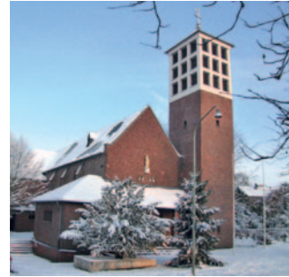
St. Rochus Dalheim