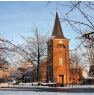
St. Mariä Himmelfahrt Rickelrath

Merbeck · Rickelrath St. Maternus-Straße 3 Mo 9:00 bis 11:00 Uhr Tel 02434-4607