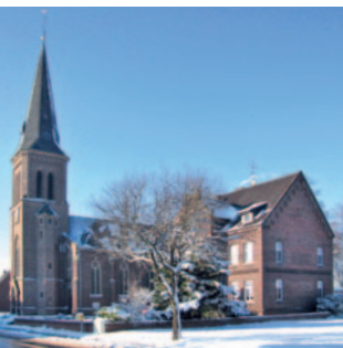
Zur Heiligen Familie Klinkum

Gottfried-Plaum-Str. 5 Di 9:00 bis 11:00 Uhr Tel 0 24 34 - 33 86 klinkum-info@SanktMartinWegberg.de