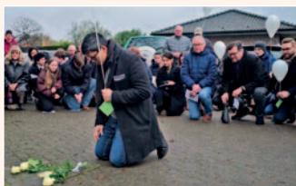
Stolpersteinverlegung in Rickelrath