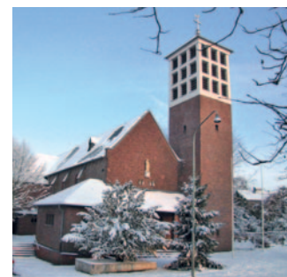
St. Rochus Dalheim