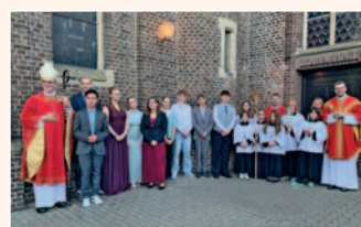
Firmung in Arsbeck