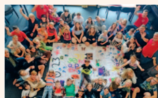
Ferienfreizeit Sankt Martin HILFT