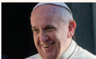
Papst Franziskus +