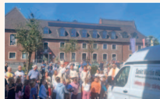
Fahrzeugsegnung Sankt Martin HILFT