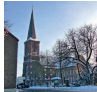
St. Maternus Merbeck

Mi 15:30-17 Uhr, So 10-12 Uhr, jd. letzten Fr/Monat 17-20 Uhr.