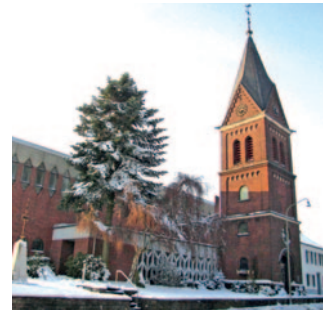
St. Johann Baptist Wildenrath