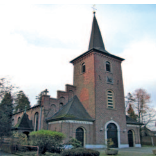
St. Rochus Rath-Anhoven

Josef-Loogen-Straße 4 Mi 17:30 bis 19:00 Uhr Do 9:00 bis 11:30 Uhr Tel 02431-5586