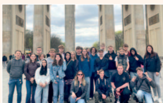
KATHO on Tour in Berlin