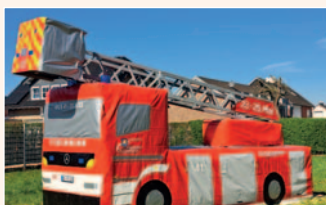
125 Jahre Feuerwehr Klinkum