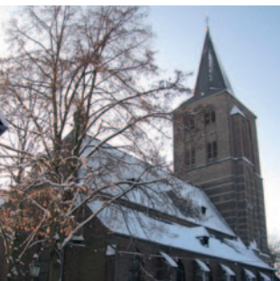
St. Vincentius Beek