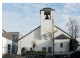
Evangelische Friedenskirche und Gemeindehaus Martin-Luther-Straße, Wegberg